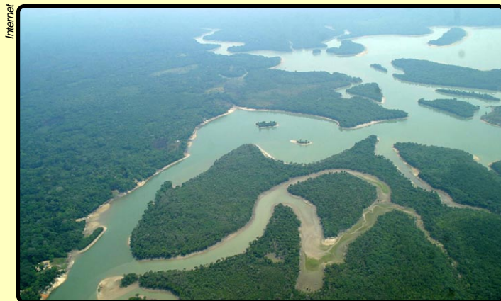
Riquezas naturais pouco exploradas despertam interesse estratégico

Na visão do diretor do Inpa, o projeto do MCTI, que teve a colaboração de pesquisadores e de institutos de pesquisa, precisa avançar mais para atender às necessidades locais. “É preciso