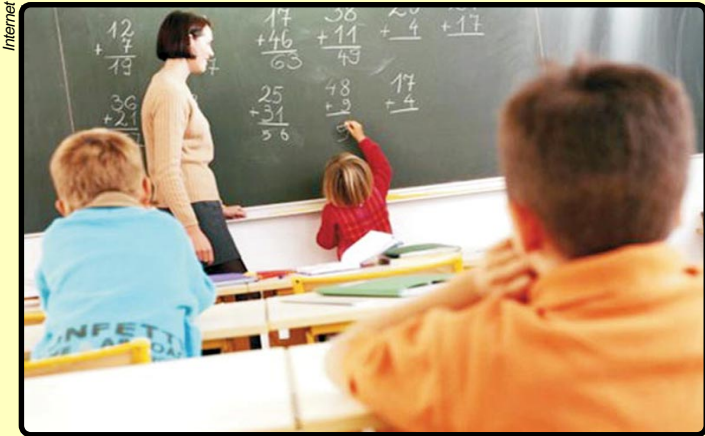
Ensino de qualidade para todos é a principal missão

Em busca de qualidade, o movimento Todos pela Educação quer formação adequada e sólida para o professor do século XXI